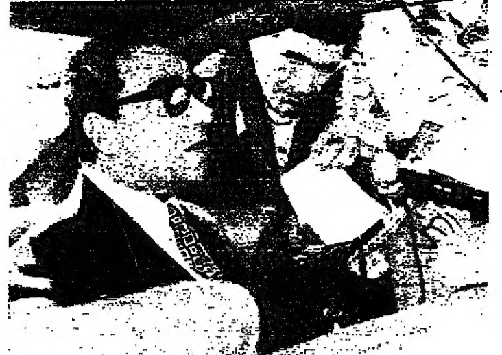
السفير المصري يلقى بتصريحاً للصحافيين

تطورات الأوضاع اللبنانية في وقتها الاطراف العربية منها في الاضطلاع الى التحرك العربي على الصعيد الدولي كالتصريح بفتح وتقييم بين الرئيس اليباس سركييس وسفيري مصر والسعودية في القصر الجمهوري فيل قاهر امس .